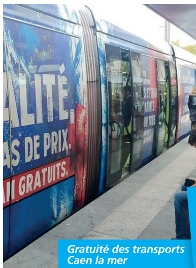
Gratuité des transports Caen la mer

LE DROIT DE SE DEPLACER NE DOIT PAS CÔTER.