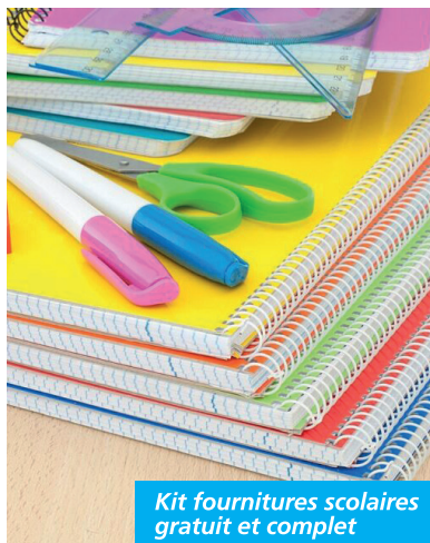
Kit fournitures scolaires gratuit et complet